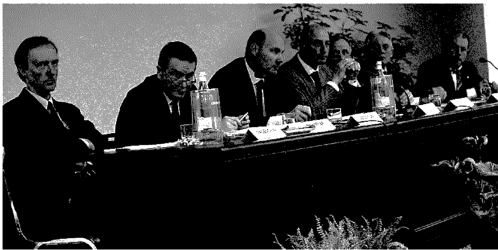
Assemblea Il tavolo di presidenza e, in alto, il pubblico. Erano presenti anche studenti del «Bocchialini».