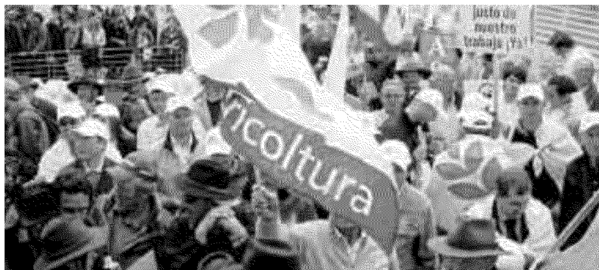
Una manifestazione di protesta di agricoltori a Lussemburgo